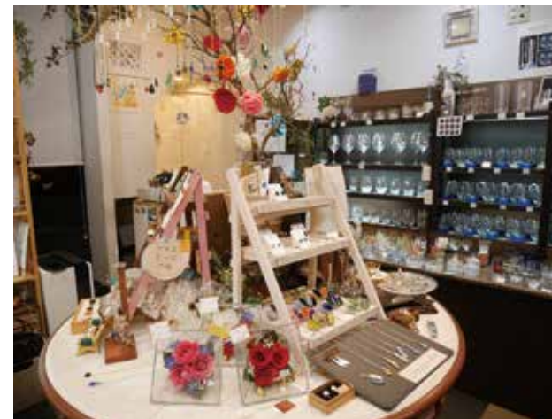
店内にはグラスやアクセサリなどのガラス作品の他にも木を使ったアクセサリや革作品がずらり。繊細なデザインの雑貨とあたたかな店主の人柄に癒される。

きらきらと光をまとったガラス作品が並ぶアトリエキース。繊細なガラスに少し緊張しながら店内に入ると、穏やかな店主がやさしく迎え入れてくれる。スタンドグラスやサンドブラストの技法により生まれるガラス作品は、繊細でやさしい表情が魅力。ひとつひとつ丁寧につくられた作品は、日常にそっと彩りを添えてくれる。あなただけの特別な一点にきっと出会えるはず。