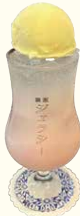
メロンソーダ 桜色