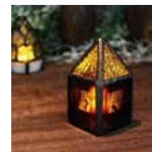
【ネコがいる赤いお家】