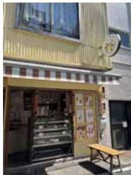
テイクアウトが可能な店外。お客様の目を楽ませてください。