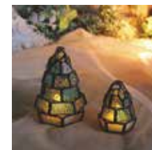
【ちいさなみもの木ランプ】