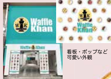
看板・ポップなど可愛い外観

ワッフルカーンジャパンにて国内でスタートを切り、学生を含めたスタッフの選択肢の一つとして、店舗を構えている。卒業しても興味があれば、選択してもらう為に始めた笑顔で話す。ワッフル生地は、国産の生地では同様の軽さが出ない為、韓国の材料を輸入し、現地のおいしさをそのまま再現し続けている。輸入困難な時期でも変えたりはしない。「情熱を持ち続けているからこそ」人気に繋がっている。