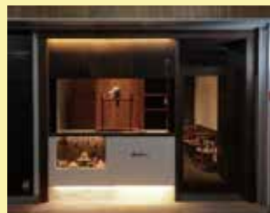
店舗は、非常に落ち着いた作り。モンブランのイメージを引き立てている。

食 へ歩きメニューには「黄金モンブランソフト」がオススメ。疲れた体を癒してくれます。