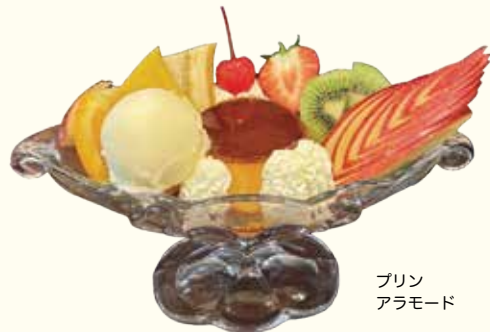
プリン アラモード

ほっとするあの味 喫茶ジェラシーのプリンは昔ながらの固めプリン。スプーンを入れるとしっかりとした弾力があり、卵のコクとほろ苦いカラメルバランスが絶妙。バナラビーンズが程よく入っていてバナラ風味も豊か。他にも昔ながらのパターライスのオムライスや、王道のナポリタンを名古屋流に仕上げた鉄板ナポリタン、製粉会社と何度も試作を重ねた粉を使用した、ここでは味わえないホットケーキなど、こだわりの詰まったメニューが揃っている。