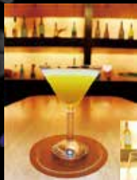
爽やかな口当たりのシンデレラ (ノンアルコールカクテル) 雰囲気にもよく合うグラスで大人な雰囲気を味わえる。