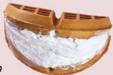
定番ホイップクリーム

ワッフルカーンジャパンにて国内でスタートを切り、学生を含めたスタッフの選択肢の一つとして、店舗を構えている。卒業しても興味があれば、選択してもらう為に始めた笑顔で話す。ワッフル生地は、国産の生地では同様の軽さが出ない為、韓国の材料を輸入し、現地のおいしさをそのまま再現し続けている。輸入困難な時期でも変えたりはしない。「情熱を持ち続けているからこそ」人気に繋がっている。