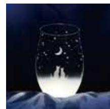
【一緒に見る三日月の夜空】