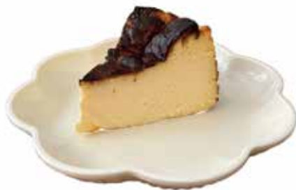
バスクチーズケーキ 厳選した北海道のクリームチーズと生クリームを贅沢に使用。トロっとした食感と深みある濃厚なチーズを感じて頂きたい♪

大通りの間にある路地に入るとすぐに見つかる可愛らしいお店。2F 席もありゆっくりとくつろぐ事が出来る店内となっている。バスクチーズケーキの専門店のため、季節毎に限定商品が出る事もあり、お客様を飽きさせない工夫も取られている。