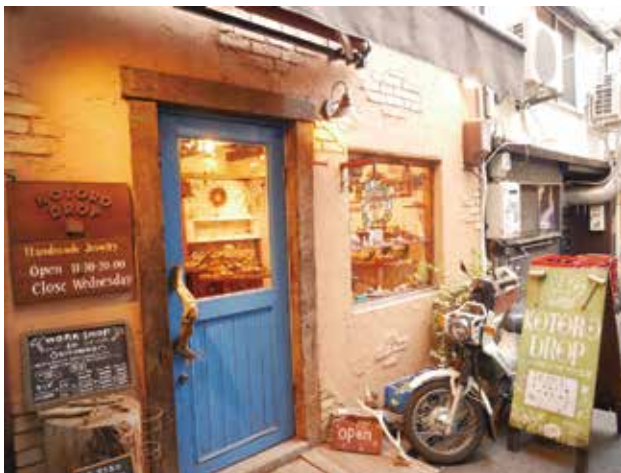
可愛らしい外観。目を惹く青色のドアが目印

東 仁王門通りから一步外れてふと入り込んだ路地裏。そんな場所で出会うのがハンドメイドのアクセサリショップ、KOTORO DROP。扉を開けると広がるのは、まるで小さな美術館のような空間。羊のコトロが旅する世界をひとつひとつアクセサリに落とし込んでいる。路地裏で迷い込むように出会い、物語をそっと身につける。KOTORO DROPはそんな特別な体験をくれる場所。